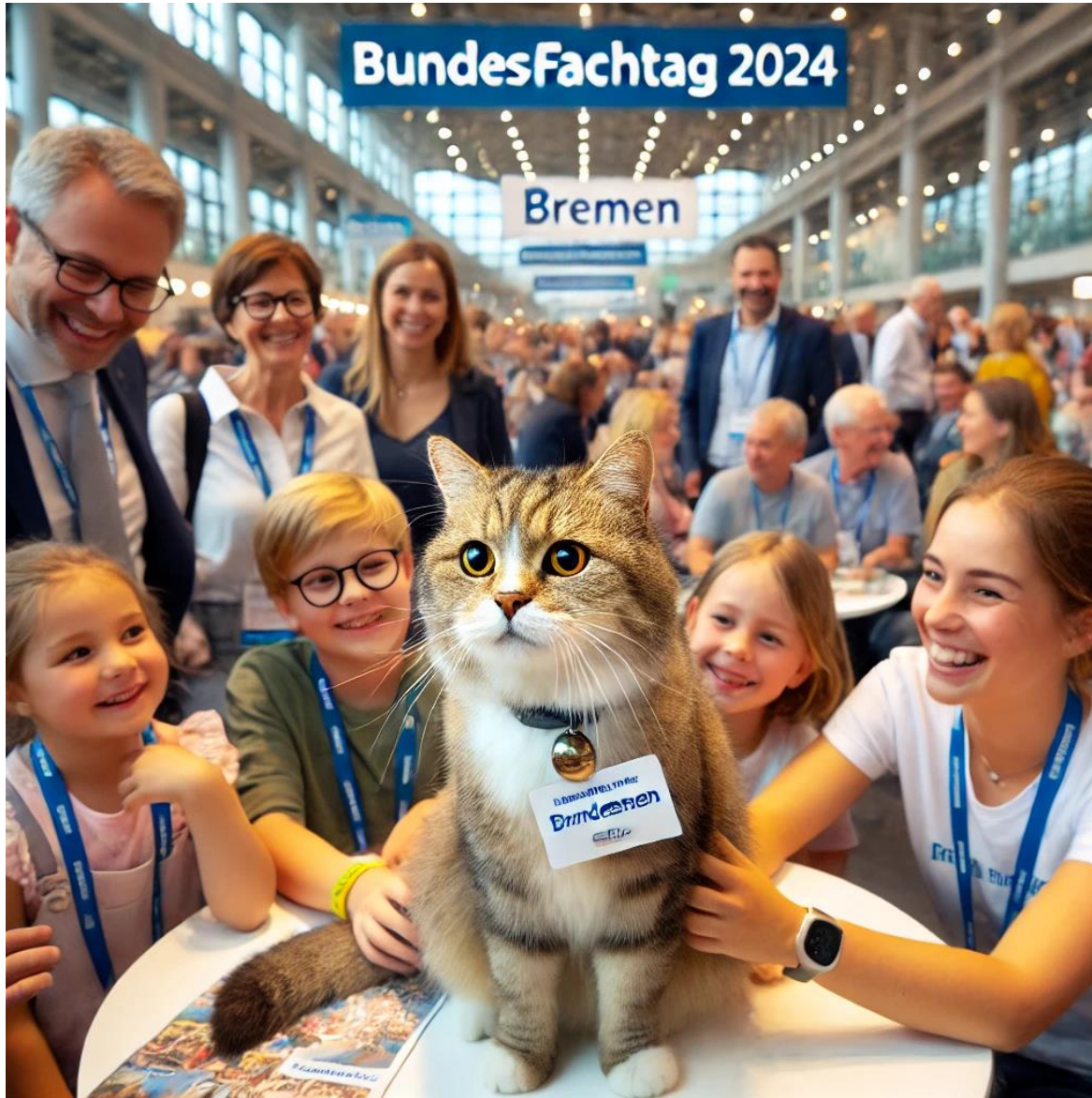
Bundesforum Familienzentren - Bundesfachtag - BVdFZ - 07.11.2024 - Bremen